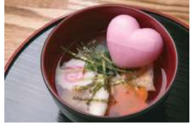
アンとミツのお雑煮は、おもち1つ入りで600円、おもち2つ入りで650円。

でとった香り豊かな出汁は、しっかりした風味。お雑煮の具には人参、大根、しいたけ、三つ葉、刻み海苔と、ここにもピンクの最中の皮が添えられます。