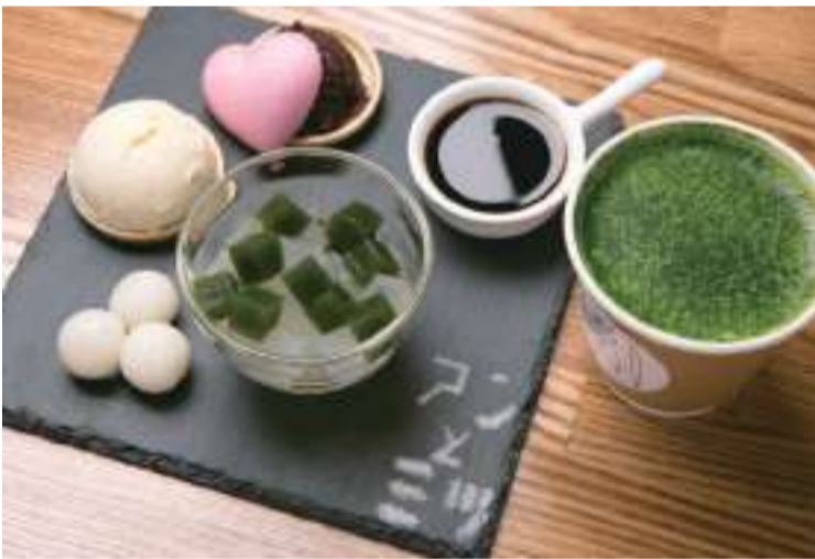
クリームあんみつ(850円)と抹茶ラテ(500円)。セットで注文すると抹茶ラテは200円引きになります。