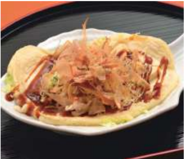
ふんわりと軽節のかかった、お好み焼き350円は軽食に人気。