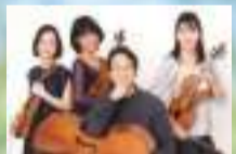
クアルテット・アルモニコ