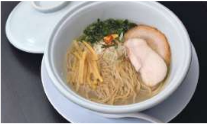
上: あっさりとしたつけ汁に自家製の平打ち麺がよく絡む「つけ麺」850円。 下: 鶏と二枚貝を合わせた透明感のあるスープが女性にも支持される「塩らーめん」800円。

「おいしいこと、オリジナリティのある一杯を提供することはもちろんですが、女性がおひとりでも気兼ねなく入れるお店づくりを心がけています」と語るように、店内は隅々まで清掃が行き届いたクリーンで明るい雰囲気。ヘアゴムや紙エプロンを常備するなど、女性客へのちょっとした心配りも細やかです。