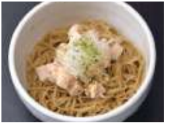
替え玉サイズ(100g)の「和えそば」。取材時は「醤油の和えそば」でした。200円。

麺の上にはトマト、ユズ、アオサのジュレが添えられています。「麺とジュレはよく混ぜた方がつけ汁が冷めにくくなるので、おいしく召し上がれますよ」と、おすすめの食べ方を教えてくれました。しっとりモチモチの麺が鶏と二枚貝を合わせた黄金色のつけ汁とよく絡んでこれまた絶品です。