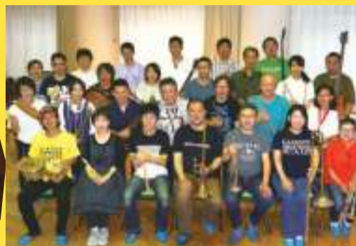
ARAKAWA JAZZ楽団 [2019年メンバー]