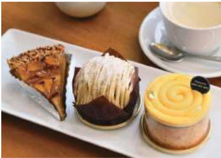
(左)「りんごとバジルのタルト」475円。(中)「和栗のモンブラン」518円。(右)「シトロンレジェール」529円。 焼きたて2週間以内の生クリームのセットで842円。