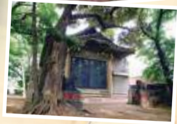
本社神輿を保管する神輿蔵。戦前のコンクリート建築としては、大変貴重なものらしい。

荒川区に数多くある史跡・文化財。それは、古くから連綿と続く人々が生きてきた証し。この地に残された『あらかわの記憶』を紹介します。