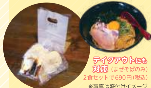
テイクアウトにも対応（まぜそばのみ）2食セットで690円(税込) ※写真は盛り付けイメージ