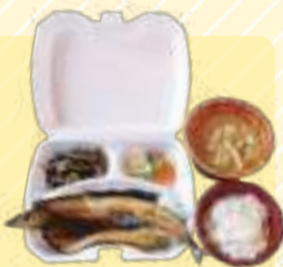
さば、ほっけ、さんまから選べる干物定食 900円(税込)

八百屋さんだった店舗を改装したコミュニティスペース。2019年11月のオープン以来、小さなお子さんをもつママたちや近所のお年寄りが気軽に立ち寄れるふれあいの場になっています。栄養満点の日替わり定食（テイクアウト可）も人気です。