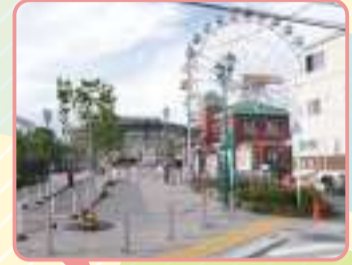
あらかわ遊園 6月末までの土・日は事前予約が必要です。 平日は事前予約なしで入園できます。火曜定休。