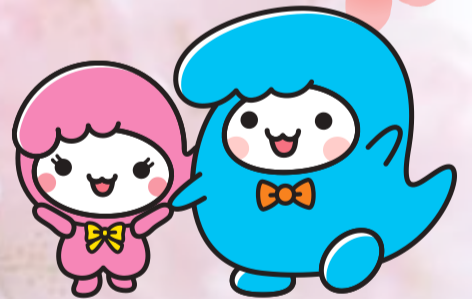
あらみい・荒川区 2012 27-0016 あら坊・荒川区 2010 27-0016

サンパール荒川リニューアルフェスタは今月号から3月号まで特集を組み、内容をご紹介します。 今月は第一弾として、大ホールでの発表及び集会室での展示を行う、文化団体連盟をご紹介します。文化団体連盟は区内で文化活動を行っている団体です。