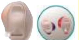
販売名 左右をわかりやすくしたカラーシエル(無料オプション) 補聴器HI-C1M