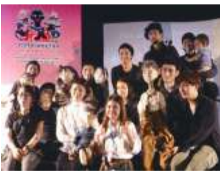
「ハーモニーワールドパペットカーニバル」にて「からすたろう」終演直後、現地メディアと

「荒川区の小学校で人形劇を観てもらう機会を持ちたいですね。例えば、「からすたろう」は、いじめがテーマでありながら、いじめという言葉が一切使われていない物語です。そうした作品を通して、子どもたちと個々の価値観といったことを考える時間を共有できたらと思っています。また、障がいのあるきょうだいがいる子どもへのケアも考えています。家族の目が障がいのあるきょうだいにばかり向けられ、ストレスを抱えている子どもたちが、人形を媒介することで心も開きやすくなり、共感しやすくなるようなワークショップも予定しています。いろんな意味で調和をもたらす人形劇を、子どもから大人まで、もっと多くの方に楽しんでもらいたいですね」