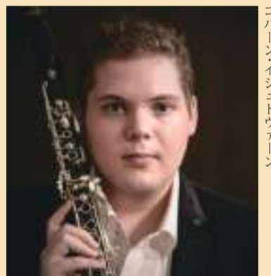
コハーン・イシュトヴァーン