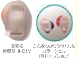
販売名 左右をわかりやすくしたカラーシェル(無料オプション)