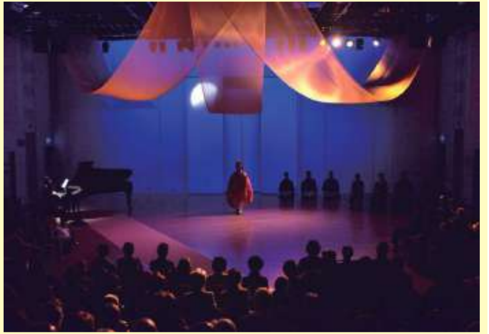
【昨年の公演より】

午後1時30分～午後2時30分(30分前開場) 入場無料 ※申込みは不要です。直接会場にお越しください。問合せ: ACC ☎3802-7111 助成: 一般財団法人 地域創造