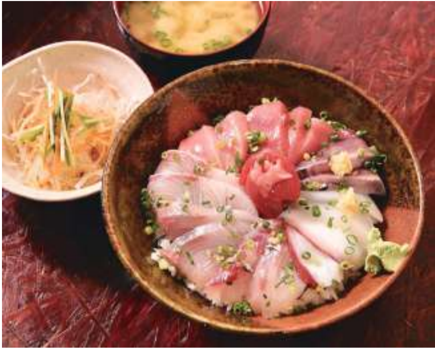
ランチメニューのなかで一番人気、名物「日替海鮮丼」(980円)は、みそ汁とサラダ付き。

都電「宮ノ前」停留場から商店街を進み、東京女子医大東医療センター手前の路地を右に入ると、割烹を思わせる真っ白なれんと木の引き戸で迎えてくれる「尾久市場」