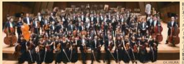
新日本フィルハーモニー交響楽団