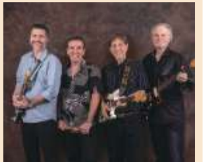
チケット販売所 町サ日

問合せ: M&Iカンパニー ☎5453-8899 ※未就学児膝上無料 ※車いすを利用する場合は事前にご連絡ください