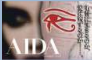
チケット販売所 町サ