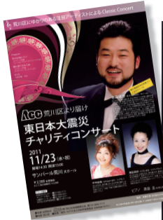
詳しくは4ページを ご覧下さい。

明日への希望と祈りを込めて、 若手アーティストが歌う ACCチャリティコンサート。