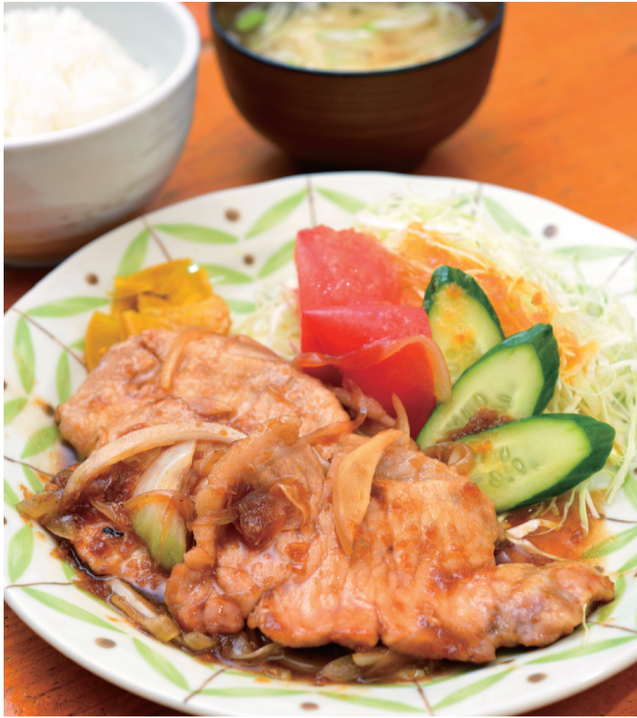
定番人気の「生姜焼きライス」(900円)は、ご飯とお味噌汁付き。食事とセットなら、コーヒー・紅茶は200円

都電の「町屋二丁目」停留場から三ノ輪橋方面歩いて2分、千代田線・京成線の町屋駅からも徒歩5分。都電の線路沿いにある白い木壁と真っ赤なドアが目を引くお店がコーヒーショップ「ファントム」。外にはメニューが書かれた黒板が並び、ドアを開ける前からワクワクさせてくれます。店内に入ると、ウッディなインテリアが懐