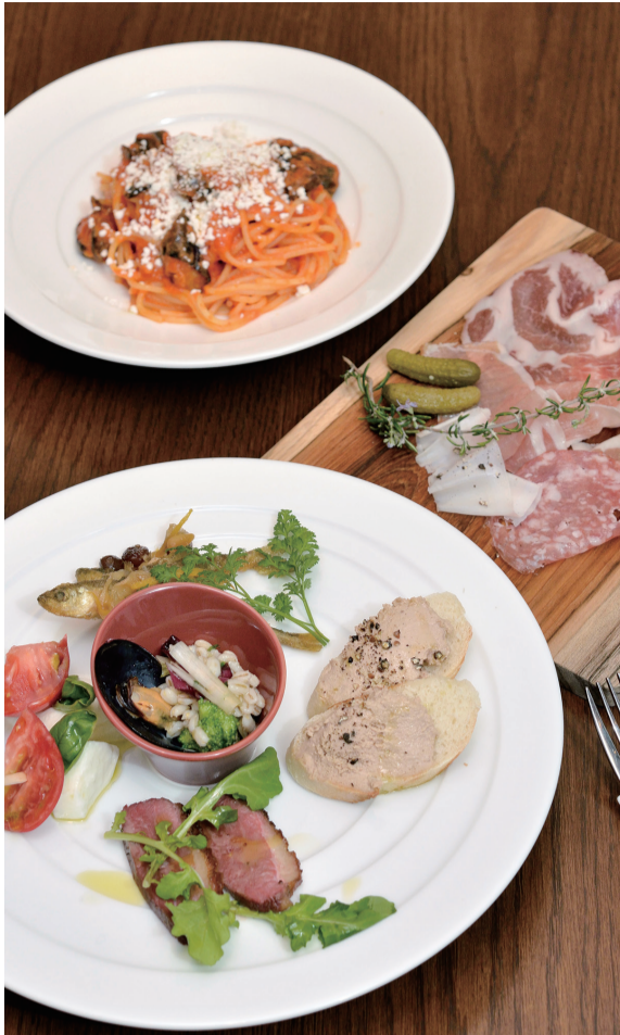
上から「茄子とリコッタチーズのトマトソースパスタ」(1,000円)、「イタリア産ハム・サラミの盛り合わせ6種」(1,500円)、「本日のシェフおまかせ前菜5種盛り合わせ」(1,500円)

地下鉄千代田線、京成本線「町屋駅」、都電荒川線「町屋駅前」から徒歩1分。尾竹橋通りから一本入ったところにある「町屋ナチュール」は、魚や肉、野菜など全国の産地直送の食材を飲食店に届ける株式会社