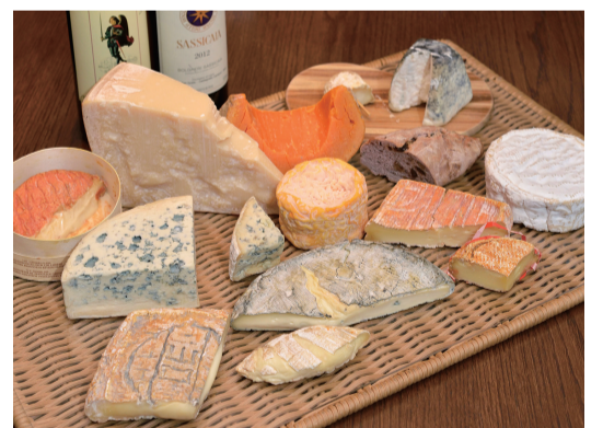
チーズは1種類からオーダーできます(1種どれでも380円)