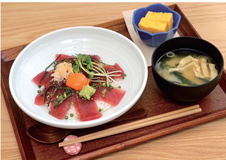
一番人気の天然マグロの漬け丼(850円)はお味噌汁と小鉢付き。ランチドリンクセットはプラス200円、ランチケーキセットはプラス500円。

ランチメニューで一番人気は、旨味たっぷりの天然マグロの漬け丼(850円)。カフェでは意外なメニューですが、ケータリング事業で常に安定して仕入れられるからこそその一品です。ほかにも6種類もの野菜とスパイスを効かせたスープカレーうどん(900円)、レンコンなどの野菜が入ったふんわりシャキシャキ食感が楽しい和風煮込みハンバーグ(900円)を中心に新メニューも続々と登場。“カフェでご飯がおいしくないのは絶対にイヤ”という思いから、味にはこだわったランチです。オリジナルの絶品チーズケーキ(400円)は、薄切りのリンゴやイチゴといったフルーツも添えられ、お得感もたっぷり。あっさりとした甘さ控えめながら、チーズの風味が感じられて、口どけもしっとりなめらか。評判がよいのも納得です。