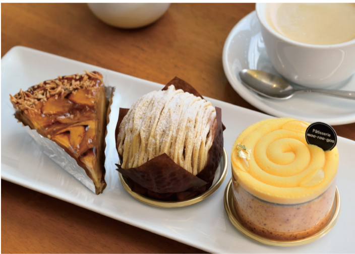
(左)「りんごとバジルのタルト」475円。(中)「和栗のモンブラン」518円。(右)「シトロンレジェール」529円。焼きたて2週間以内の生コーヒーストのセットで842円。