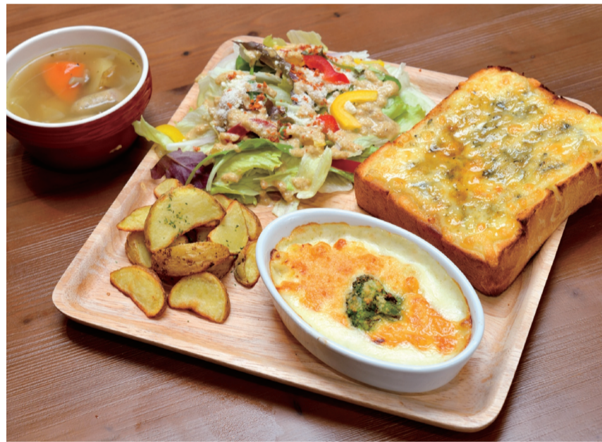
女性に人気の「ゴルゴンゾーラ&ハニーメープル」(単品は500円)。 ランチタイムのお得なセットは600円~(写真はCセット800円)+200円でお好きなドリンクがつけます。

「8 CAFE」で提供されるトーストのラインナップは16種類にもなります。思わず目移りしてしまいそうなバラエティに富んだメニューの中からチョイスした「ゴルゴンゾーラ&ハニーメープル」がテーブルに運ばれてきました。こんがり焼き上がった厚さ3cmのトーストの上のったゴルゴンゾーラチーズの程よい塩気と、メープルシロップの甘さが絶妙にマッチ! 初見さんの経験がキラリと光る、人気の一品です。ランチタイムは3種類のセットを用意。写真はホクホクの皮付きポテト、しょうゆベースの自家製ドレッシングがかかったサラダ、日替わりのスープ、さらにグラタンまで味わえるボリュームも